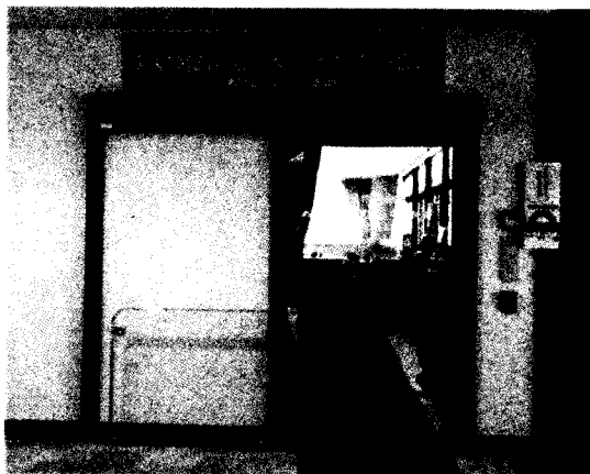
▼ 高齢者あんしん相談センター長房

開所日 ▼ 月~土 9時~17時 (休日:日、祝日、年末年始※12/29~1/3)